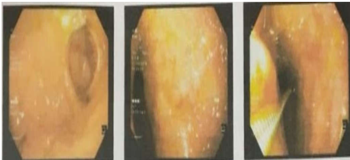
شکل ۳. وجود ضایعات اریتماتو و اروزیو در انترودنودنوم

کمتر از ۱۴ مورد در هر یک میلیون نفر گزارش شده است (۱۷).