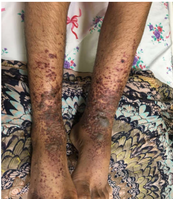
شکل ۱. وجود ضایعات پوستی بر روی اندام تحتانی دو طرف

بیمار با تشخیص شکم حاد کاندید عمل شد و پس از انجام مراقبت‌های لازم به اتاق عمل منتقل شد. تحت بیهوشی عمومی قرار گرفت و با برش میدلاین تحتانی، شکم باز شد. عمل جراحی آپاندکتومی به انجام رسید و آپاندیس ملتهب خارج شد. پس از اتمام عمل، بیمار به بخش جراحی منتقل شد و تحت مراقبت قرار گرفت. در سیر بستری، بیمار دچار ضایعات پوستی در اندام تحتانی دو طرف شد، و ادم و درد اسکروتوم طرفین نیز در بیمار وجود داشت.